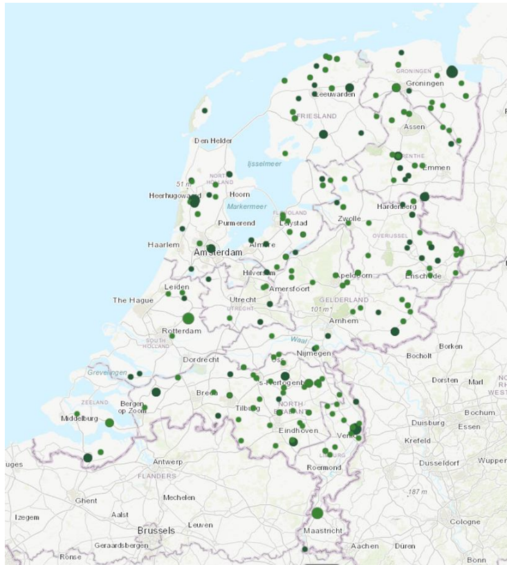
Figuur 1. Mestvergisters in Nederland. Het kaartje is van 2020. De grote mestvergistingsinstallatie bij Zelder ontbreekt nog.

Bij de eerste vergisters in Nederland zijn veel kinderziektes naar voren gekomen, wat ook voor overlast heeft gezorgd, maar daar is van geleerd. In Nederland is inmiddels dus veel ervaring met vergisters.